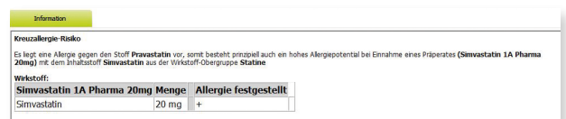
i:fox® Bibliothek am Beispiel eines Allergie-Checks des ifap praxisCENTER® 3